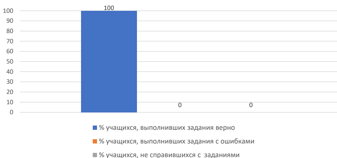
Рисунок 3. Основные результаты ДР по географии

На рисунке 3 представлены основные результаты ДР по географии в Дальнереченском городском округе.